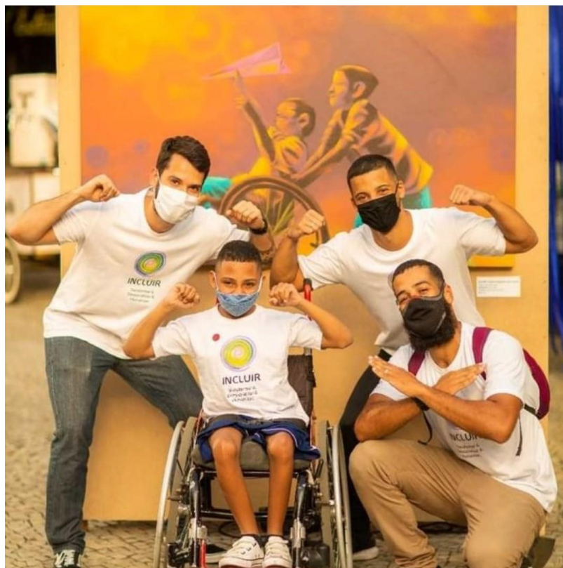
Figura 13 – Professor, estagiários e participante do Projeto de Esporte Educacional – Modalidade Natação – Evento de esporte no Rio de Janeiro, RJ.