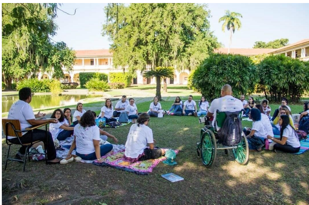
Figura 15 – Projeto de Formação Educacional/ Pulsar – Campus da UFRRJ, Seropédica, Rio de Janeiro.

[...] Acredito que eles vão ao término da formação, saírem profissionais melhores no sentido de assumir a responsabilidade de operacionalizar tudo que eles ouviram, tudo que eles trocaram que tiveram acesso e isso vai se reverter de fato num desenvolvimento nos dois lados: pra eles enquanto profissionais e para aqueles com os quais eles ao atuar na escola, nos espaços inclusivos, num clube, em qualquer outra instituição que contempla a diversidade humana (CLEMENTINA, 2019).