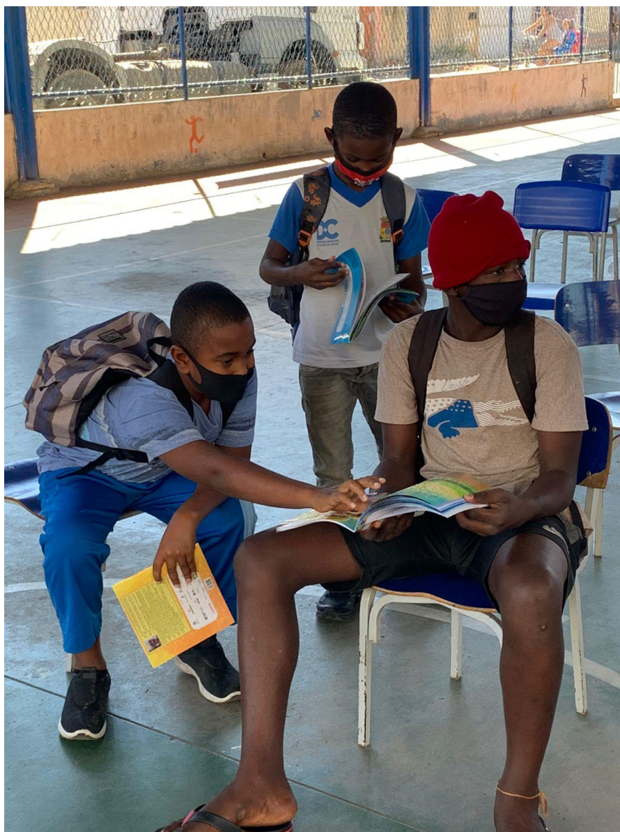
Figura 7 – Projeto Literatura Acessível. Fotografia tirada dentro de uma escola no Rio de Janeiro num encontro de contação de história e distribuição dos livros do projeto.