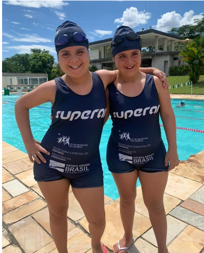
Figura 26 – Participantes do Projeto Esporte Educacional. Modalidade Natação.