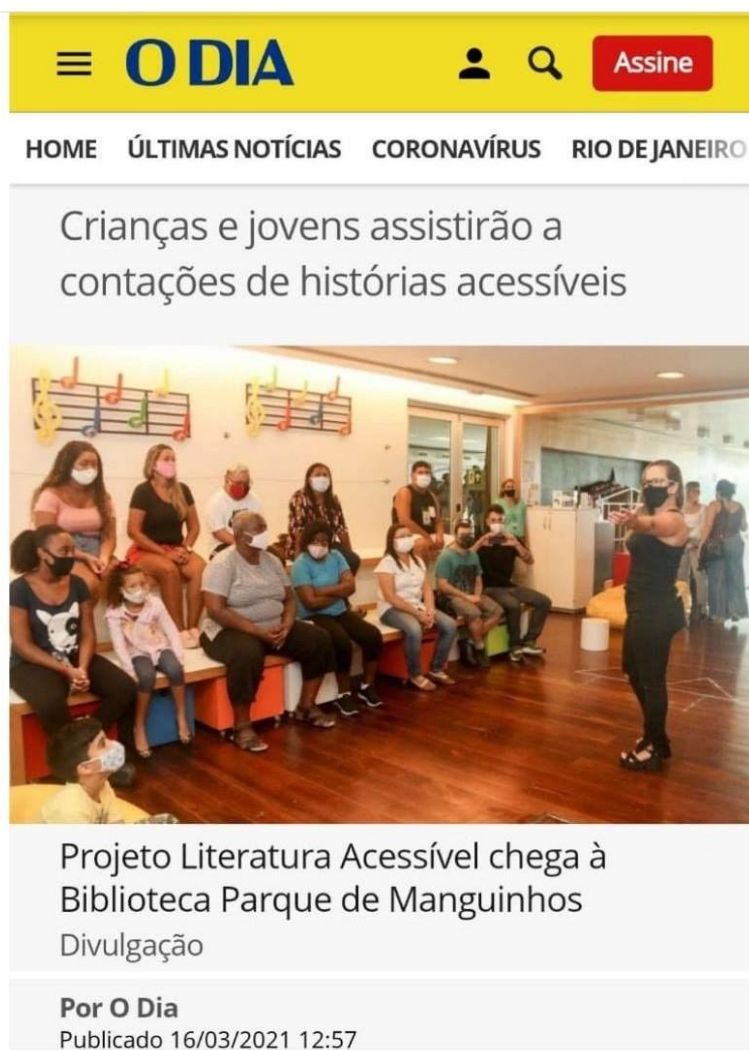
Figura 19 – Matéria no Jornal O DIA sobre a reabertura das Bibliotecas Parques na pandemia e a participação do Projeto Literatura Acessível, através da contação de histórias e distribuição de livros na Comunidade e Manguinhos, Rio de Janeiro.

Com esta contingência, tivemos um total de setenta e uma contações de histórias presenciais; com bairros/municípios do Rio de Janeiro que receberam vinte e cinco contações ou doações de livros; além de vinte e cinco cidades de fora do Rio de Janeiro que receberam doações de livros; por fim, onze Estados receberam doações de livros, além do próprio Estado do Rio de Janeiro.