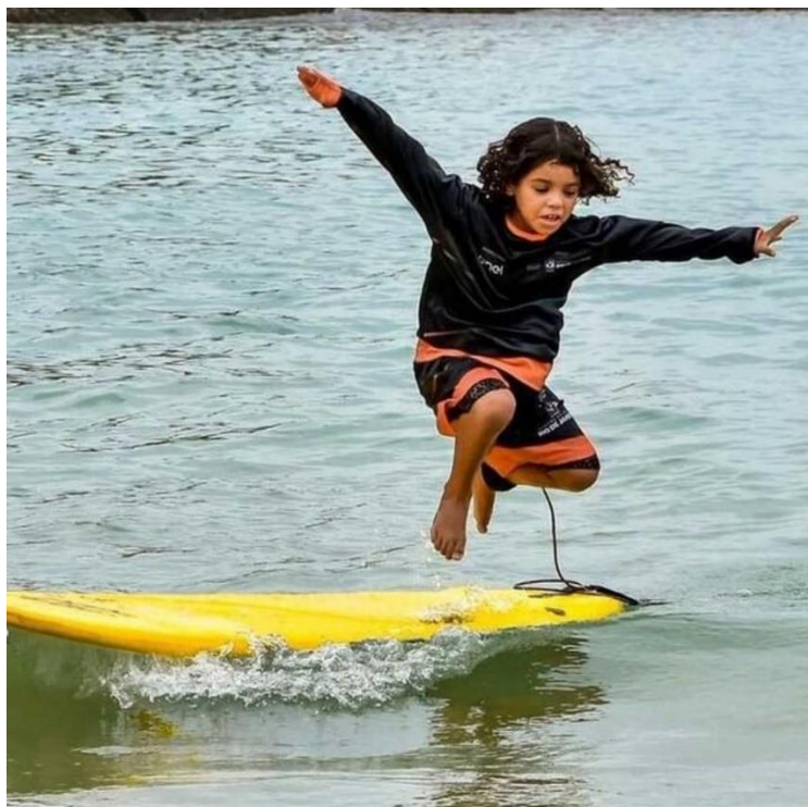
Figura 11 – Projeto Esportivo Educacional – Modalidade Surf, Praia do Recreio dos Bandeirantes, Rio de Janeiro.