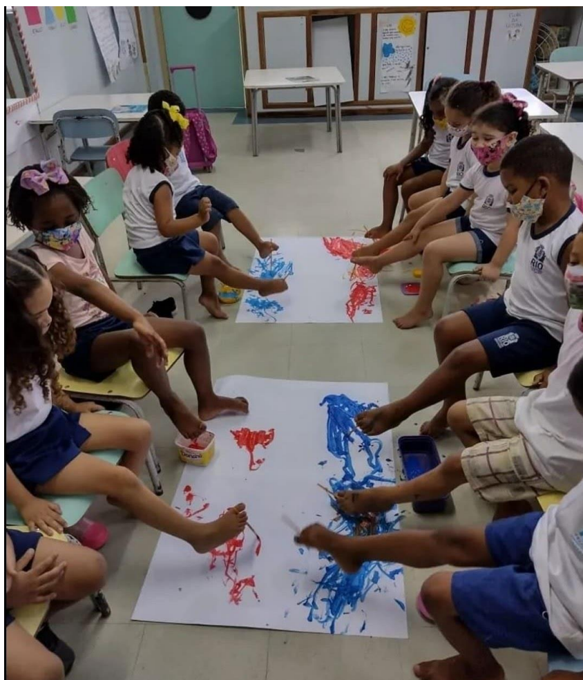
Figura 20 – Atividade de pintura a partir da leitura do livro “O menino que escrevia com os pés” do Projeto Literatura Acessível. Creche Municipal Padre Valter – Campo Grande, RJ.

No mês de maio, foram realizadas seis contações de histórias na comunidade de Curicica e Sulacap, localizada na Zona Oeste da cidade do Rio de Janeiro. Foram beneficiados cento e doze estudantes diretamente, e mais de mil estudantes indiretos, pela entrega do acervo às escolas.