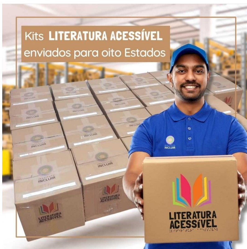
Figura 22 – Kits (com livros, pen drive com contação de histórias, atividades pedagógicas referentes a cada livro e bonecos artesanais de cada personagem dos livros) do Projeto Literatura Acessível enviado para oito estados do Brasil.

No segundo semestre de 2021, ainda foram enviados mais mil seiscentos e cinquenta livros para escolas ao redor do Brasil, em Estados como Minas Gerais, Paraná, Pará, Pernambuco, Amapá e Espírito Santo, alcançando mais de três mil estudantes indiretamente, via acervo entregue às bibliotecas das escolas.