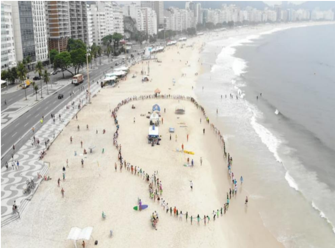
Figura 2 – Festival da Diversidade – Praia de Copacabana – 2019.