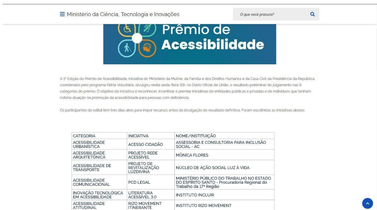
Figura 23 – Resultados dos ganhadores do prêmio de Acessibilidade do Ministério da Ciência, Tecnologia e Inovações. Fonte: Site do Ministério da Ciência, Tecnologia e Inovações. https://www.gov.br/mcti/pt-br/acompanhe-o-mcti/noticias/2021/11/premio-de-acessibilidade-divulga-resultado-preliminar-do-diario-oficial

Como medida de segurança e controle contra o Covid-19, todas as contações de histórias presenciais foram realizadas em ambientes ventilados com distanciamento social entre os estudantes, divididos em horários com pequenos grupos, e medidas de segurança e prevenção foram tomadas em todos os eventos realizados, tais como medição da temperatura corporal, o uso do álcool em gel e o uso obrigatório de máscaras.