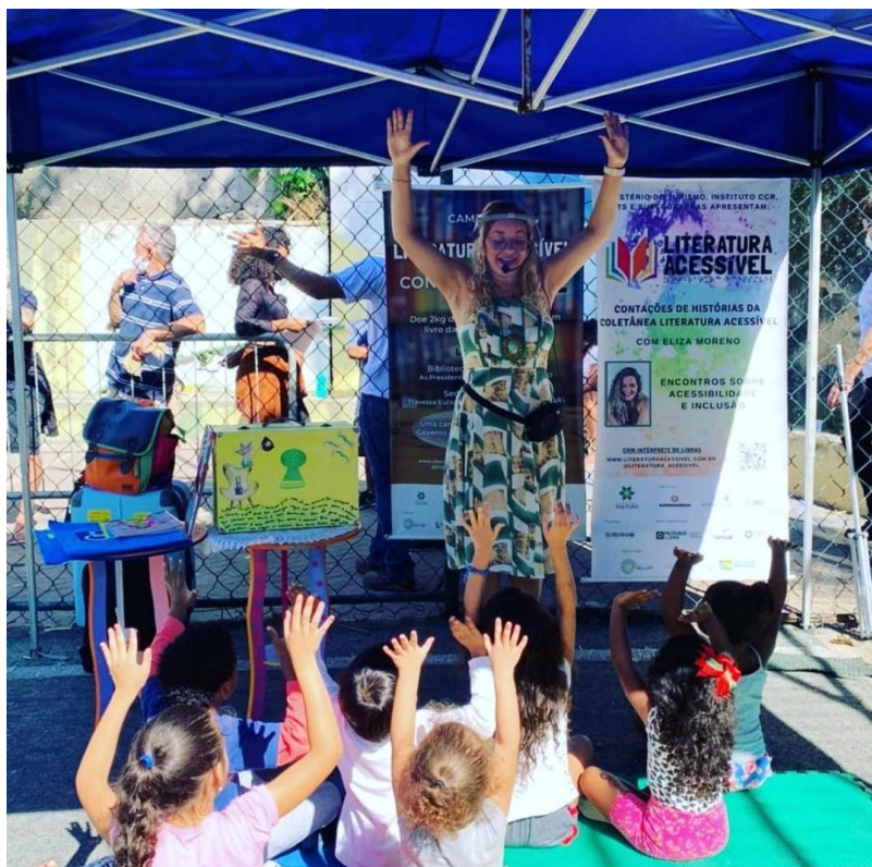
Figura 24 – Contação de Histórias dos livros do Projeto Literatura Acessível em ação social no morro do Dona Marta, Botafogo – Rio de Janeiro.