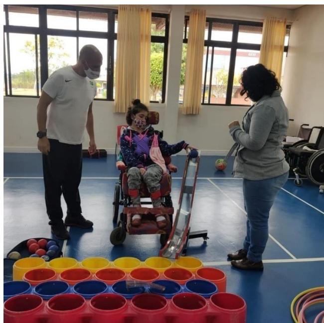
Figura 8 – Projeto de Esporte Educacional – Modalidade Bocha – Suzano, São Paulo.

Os depoimentos das famílias sobre a participação no projeto desenvolvido nos revelam diferentes visões ou compreensões a respeito do funcionamento das diversas dificuldades, enfrentadas pelas dinâmicas de exclusão social e precariedade do acesso aos direitos básicos, como a possibilidade de uma educação acolhedora e humana.