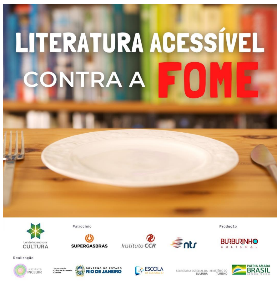
Figura 21 – Campanha Literatura Acessível contra a Fome.

Ainda no mês de junho, lançamos a Campanha Literatura Acessível Contra a Fome, em parceria com o poder público e empresas privadas, onde dois quilos de alimentos foram trocados por um livro do projeto, o que resultou em dezesseis toneladas arrecadadas, e mais de quinhentos livros distribuídos. Foram beneficiadas mais de mil e quinhentas famílias do Estado do Rio de Janeiro, diretamente, entre os meses de junho e julho.