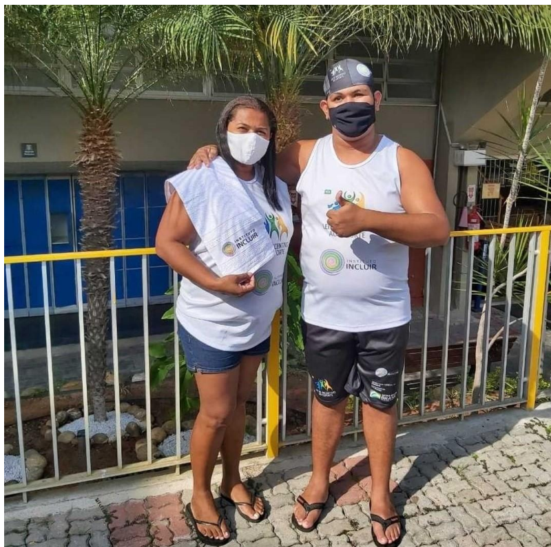
Figura 10 – Mãe e filho no Projeto de Esporte Educacional – Modalidade natação – Jacarepaguá, Rio de Janeiro.

Tendo como referência a fundamental reflexão de Theodor Adorno, compreendemos que estas possibilidades de imaginar outras realidades têm base no modelo da Teoria Crítica, quando se produzem análises e diagnósticos precisos sobre as transformações dessas mesmas realidades. Um caminho possível é entender a educação, nos termos de Adorno, quando argumenta: