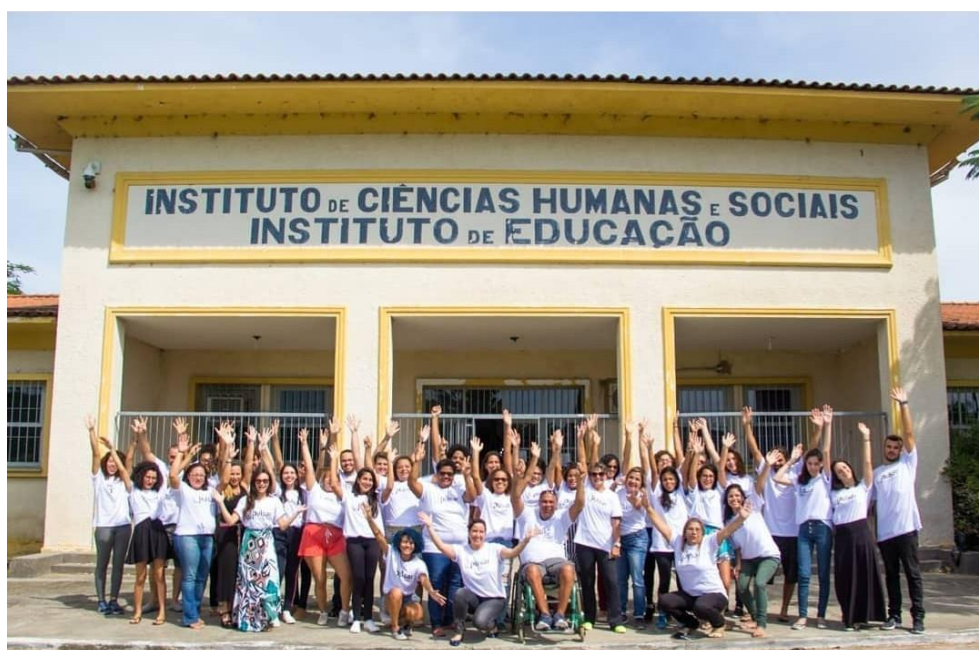
Figura 14 – Projeto de Formação Educacional/ Pulsar – Instituto de Educação – UFRRJ – Seropédica, Rio de Janeiro.

Este projeto que teve como proponente o Instituto Superar desde sua primeira edição, em 2016, até 2019. O curso oportunizou vagas para trezentos e cinquenta professores e professoras de todo o estado do Rio de Janeiro.