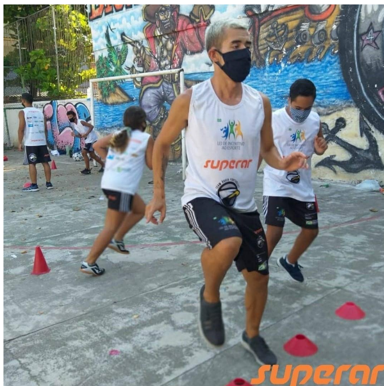
Figura 12 – Projeto Educacional Esportivo – Modalidade Futevôlei – Rocinha, Rio de Janeiro.