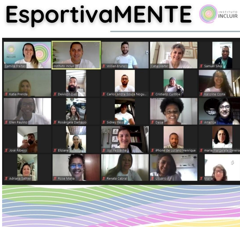
Figura 17 – Aula on-line do Projeto EsportivaMENTE.

Este projeto que tem como proponente o Instituto Incluir aprovado em 2020, executado em 2021 no segmento on-line. O curso oportunizou vagas para 180 professores e professoras de todo o Brasil, alcançando as cinco regiões brasileira, além de participantes de Portugal (Europa) e Cabo Verde (África).