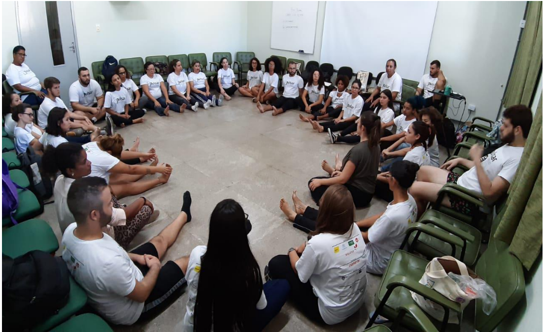
Figura 1 – Projeto Pulsar – 2019 – Instituto de Educação/UFRRJ.

“Para ser educador, basta ser gente, e perceber que aprendemos uns com os outros”