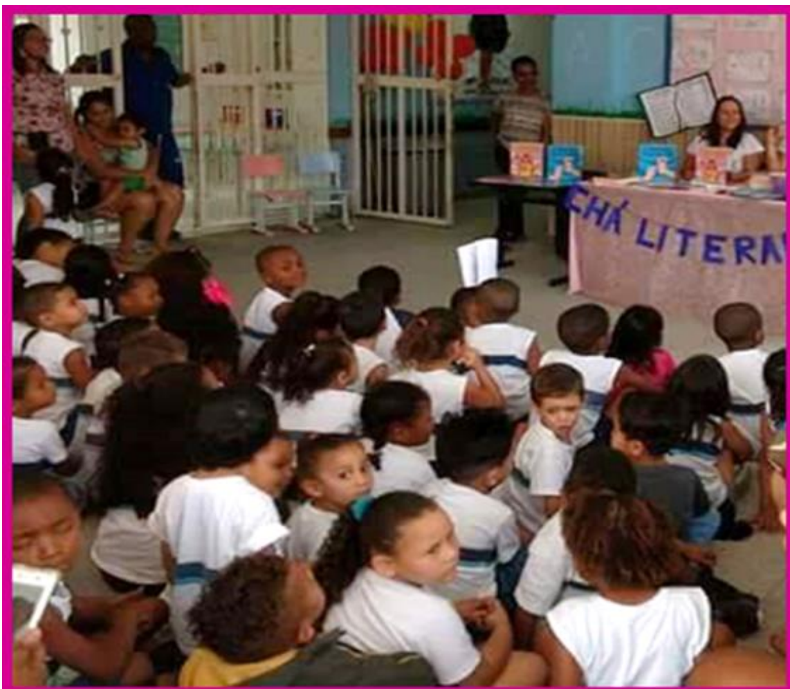
Figura 4 – Chá Literário com a participação dos estudantes e professores da Creche Municipal Padre Valter da Costa Santos – Campo Grande, RJ.

“Se o indivíduo desaparece, a sociedade também desaparecerá”