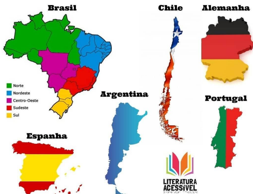
Figura 18 – Mapa mostrando a abrangência do Projeto Literatura Acessível em tempos de pandemia.

Aqui vamos analisar as atividades do Projeto Literatura Acessível durante a Pandemia. Este projeto teve sua execução totalmente modificada diante da chegada da pandemia da Covid-19, pois em março de 2020 estávamos com as passagens compradas para Jundiaí, Estado de São Paulo, para fazer a primeira entrega presencial do projeto. O projeto prevê, em sua aprovação na Lei Federal de Incentivo à Cultura, a entrega de quatro livros em multiformato, e a contação de histórias, dentro de escolas e bibliotecas públicas do Brasil.