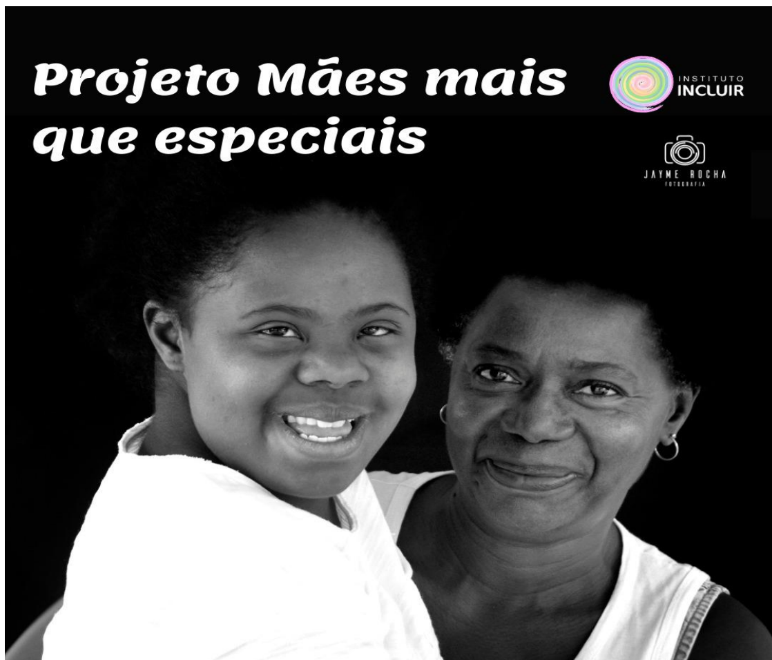
Figura 6 – Projeto Mães mais que especiais. Fotografia entre mães e filhos retratando o amor e a luta de mulheres com seus filhos e filhas com deficiência.