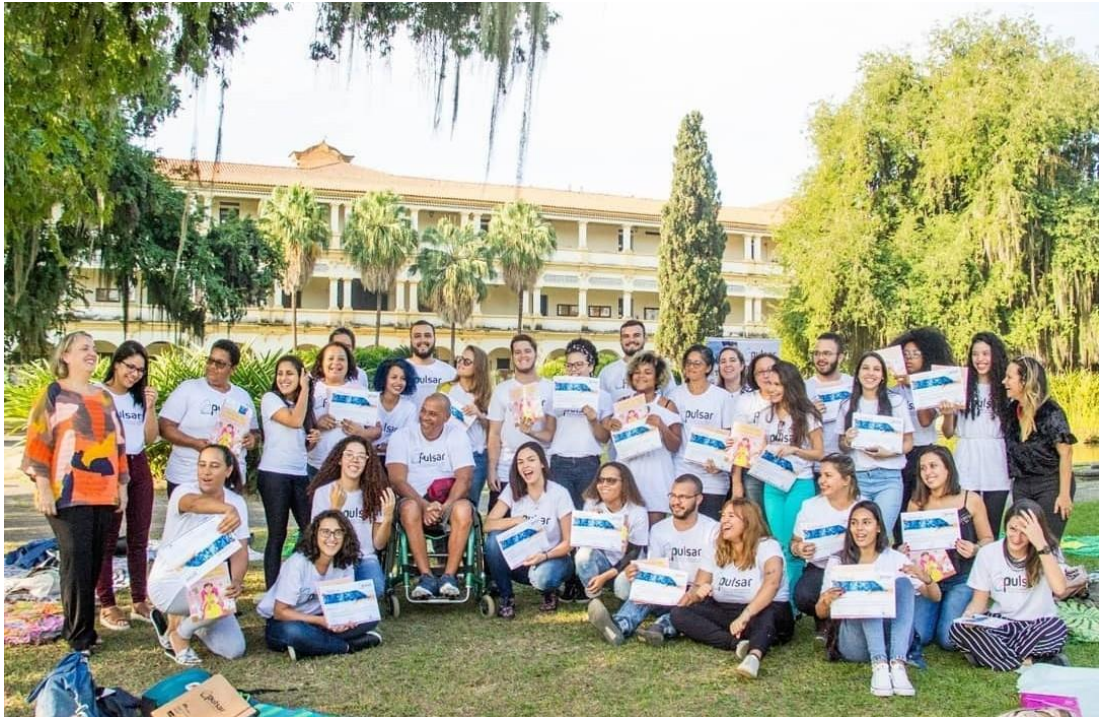
Figura 16 – Projeto de Formação Educacional/ Pulsar – UFRRJ – Seropédica, Rio de Janeiro.