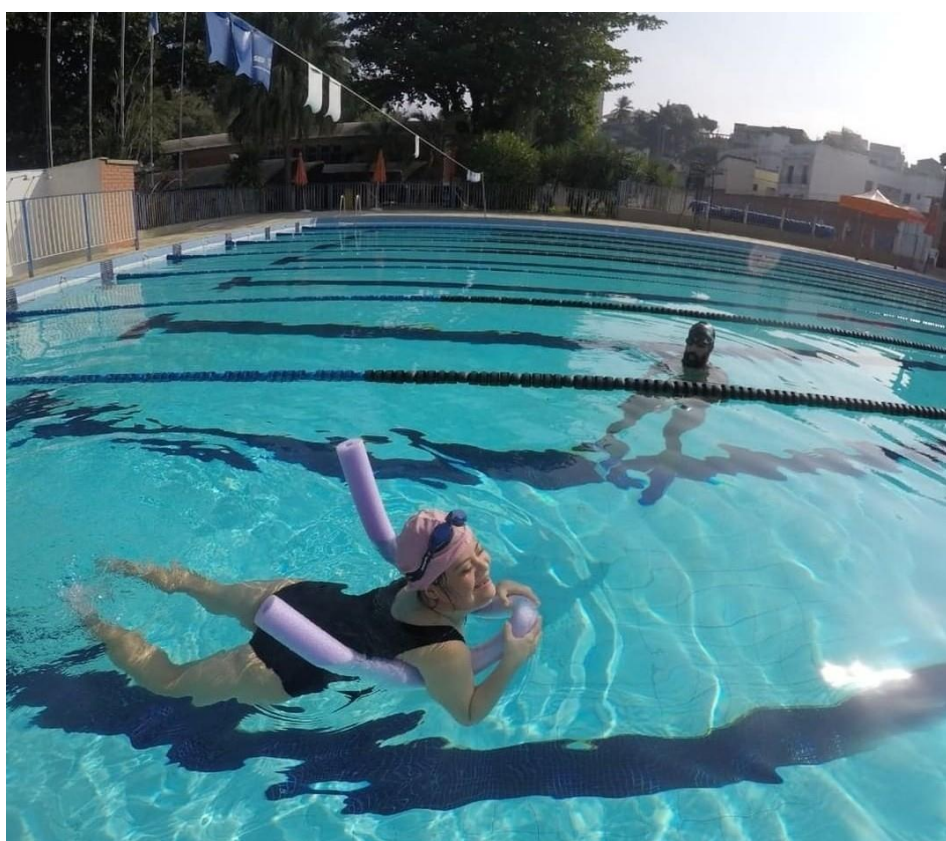
Figura 9 – Projeto Esporte Educacional – Modalidade Natação – Jacarepaguá, Rio de Janeiro.

Tais elementos convergem para um estreitamento das esperanças e expectativas, das potencialidades de desenvolvimento dos indivíduos, quando percebemos que os depoimentos de familiares indicam insegurança e dúvida acerca da continuidade dos projetos. Por outro lado, a presença e execução dos projetos parecem ocupar um desejo ou demanda por transformação, manifestados pelas famílias quando estas expressam suas percepções do que pode ser possível e do que elas experimentam com seus filhos e filhas estudantes na realidade concreta, quando entram em contato com outras pessoas, ou seja, quando a diferença é articulada como ponto fundamental do reconhecimento social e força de desconstrução de preconceitos, estigmas e lugares-comuns sobre as pessoas com deficiências.